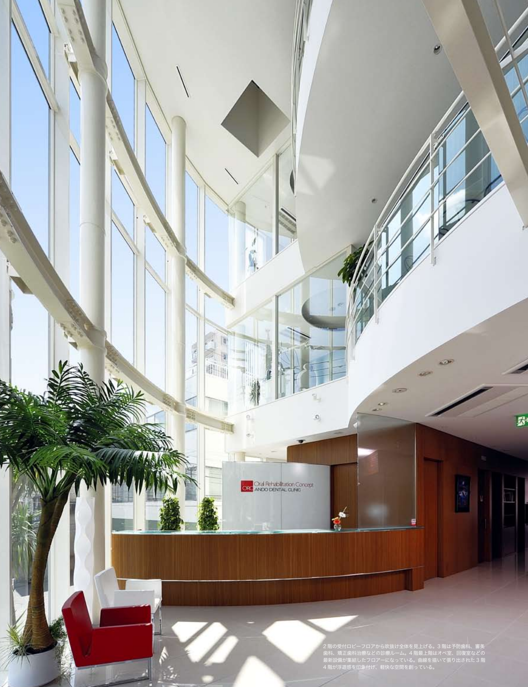
2 階の受付ロビーフロアから吹抜け全体を見上げる。3 階は予防歯科、審美歯科、矯正歯科治療などの診療ルーム。4 階最上階はオペ室、回復室などの最新設備が集結したフロアになっている。曲線を描いて張り出された3階4階が浮遊感を印象付け、軽快な空間を創っている。